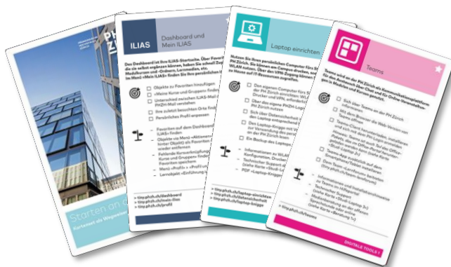
Kartenset ( tiny.phzh.ch/kartenset )

Die Karten sind also eine physische Linksammlung mit hilfreichen Kurzinformationen bereits auf der Karte selbst. Lesen Sie zunächst die Karten durch, welche mit einem Stern gekennzeichnet sind, die Zwei-Stern-Karten können sie später bearbeiten. Rufen Sie über die Links die Zusatzinformationen ab und haken Sie die aufgeführten Ziele ab.