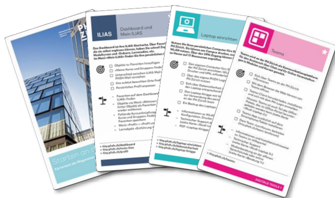
Kartenset ( tiny.phzh.ch/kartenset )

Die Karten sind also eine physische Linksammlung mit hilfreichen Kurzinformationen bereits auf der Karte selbst. Lesen Sie zunächst die Karten durch, welche mit einem Stern gekennzeichnet sind, die Zwei-Stern-Karten können sie später bearbeiten. Rufen Sie über die Links die Zusatzinformationen ab und haken Sie die aufgeführten Ziele ab.